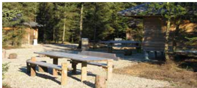
Shelterne kan bookes på: natur.herning.dk

Det er muligt, for 125 kr., at leje båludstyr, flytbar trappe og kran, til brug for handicappede, i forbindelse med shelter-bookning. Det er gratis at benytte pladsen.